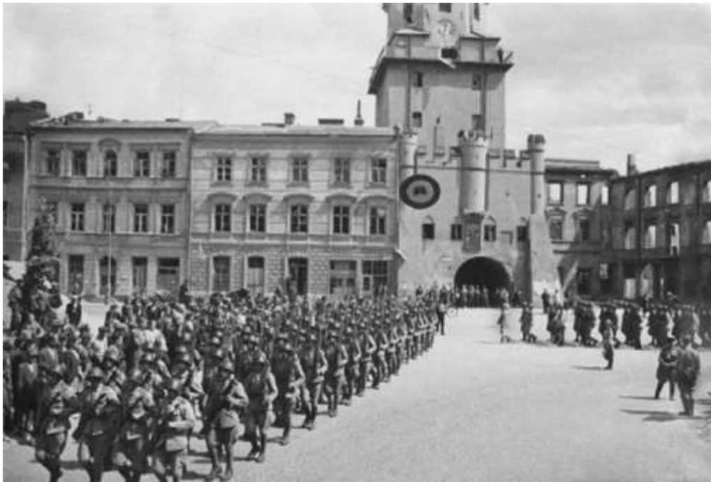
РИСУНОК 5. ПОЛЬСКИЙ ГОРОД ЛЮБЛИН ВО ВРЕМЯ ВТОРОЙ МИРОВОЙ ВОЙНЫ [10].

Люблин-Брестская наступательная операция была проведена войсками 1-го Белорусского фронта с целью разгрома брестской и люблинской группировок противника. С немецкой стороны им противостояли соединения 2-й армии и 9-й армии группы армий «Центр» и 4-я танковая армия группы армий «Северная Украина».