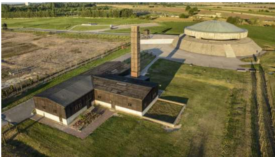
РИСУНОК 6. КОНЦЕНТРАЦИОННЫЙ ЛАГЕРЬ МАЙДАНЕК [13].

Концлагерь, созданный фашистами 20.07.1941 года как трудовой, стал настоящей фабрикой смерти. За время существования в лагере побывало 150 тысяч заключённых, из которых 80 тысяч казнили.