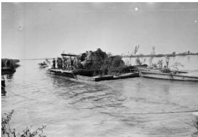
РИСУНОК 7. ФОРСИРОВАНИЕ ВИСЛЫ [16].

В ходе Висло-Одерской операции от немецких войск была освобождена территория Польши к западу от Вислы и захвачен плацдарм на левом берегу Одера, использованный впоследствии при наступлении на Берлин. Операция но-