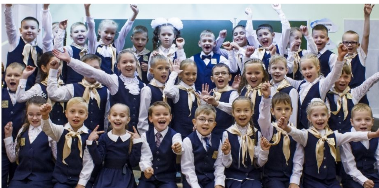
Рис.1 «Ученики МАОУ "Гимназия №6" г.Перми»

Я изучила поставленный вопрос на примере учеников МАОУ «Гимназии №6» г. Перми (рис.1) в своей научно-исследовательской работе.