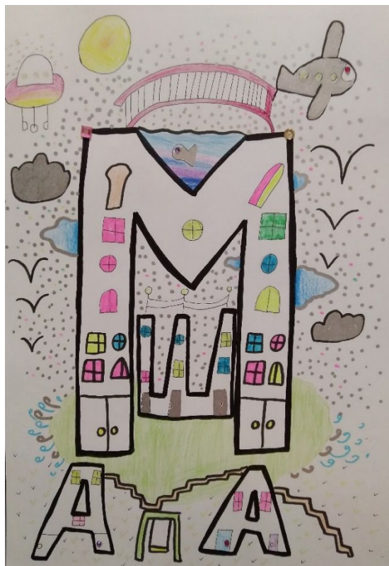
Рис.5 «Композиция из букв»

Один раз в неделю я посещаю факультативный курс «Пишу красиво» в МАОУ «Гимназия №6» г.Перми, где я получаю знания и навыки правильного письма (рис. 4).