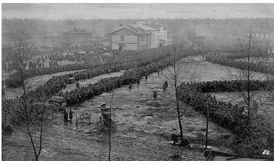
Vom östlichen Kriegsschauplatz. Brotempfang, russischer Gefangener 15000 vor dem Abtransport in Augustowo

Казалось, боль отступила, и я уже мягко куда-то проваливался, вдруг очутившись на ослепительно белом бескрайнем поле. Минуту погода на чистом листе выросли бумажные ромашки, и я неловко улыбнулся им.