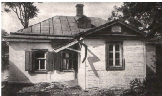
Рис. 1. Дом, в котором родился А.П. Чехов

Слайд 2. Родился в Таганроге в семье хозяина мелочной лавки (рис. 1).