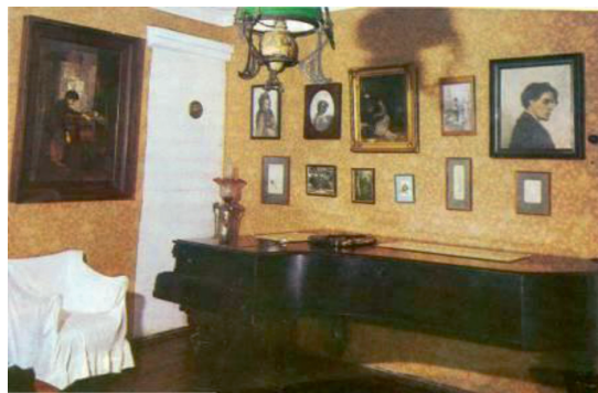
Рис. 6. Гостиная