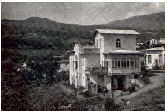
Рис. 12. Ялта. Дом А.П. Чехова

Слайд 16. И когда в 1899 году болезнь обострилась, Чеховы продают Мелихово и переезжают в Ялту (рис. 12).