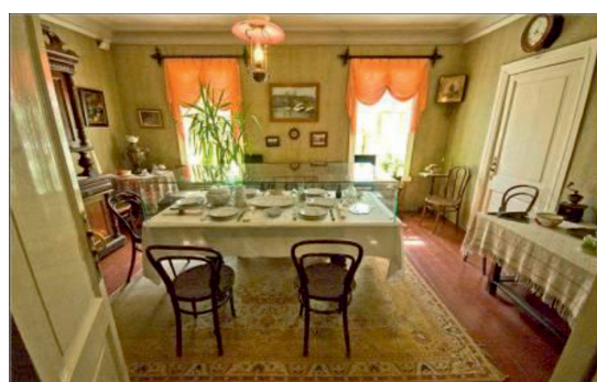
Рис. 10. Столовая

Слайд 12. А.П. Чехов провёл в Мелихове 7 лет (с 1892 по 1899 гг.)