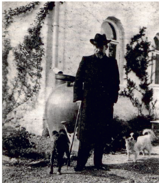
Рис. 13. А.П. Чехов в Ялте