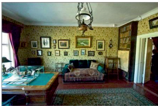
Рис. 5. Кабинет А.П. Чехова