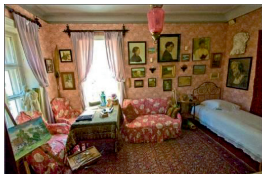
Рис. 7. Комната М.П. Чеховой