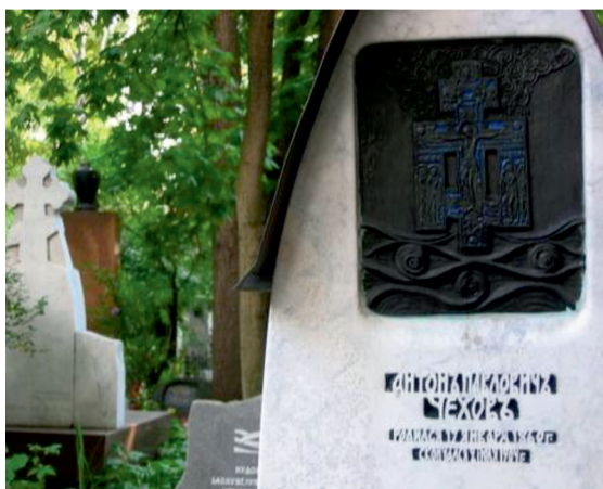
Рис. 16. Могила А.П. Чехова

Слайд 18. Антон Павлович любил, чтобы в жизни и в литературном творчестве всё было просто и понятно. Спокойной и простой была его смерть. Умер Чехов в курортном городке Баденвейлере, в Германии. По свидетельству его врача, он сказал ему спокойно: «Скоро, доктор, умру». Он выпил предложенного ему врачом шампанского, тихо лёг на левый бок и вскоре умолкнул навсегда. Тело Чехова было перевезено в Москву, похоронен он на Новодевичьем кладбище (рис. 16).