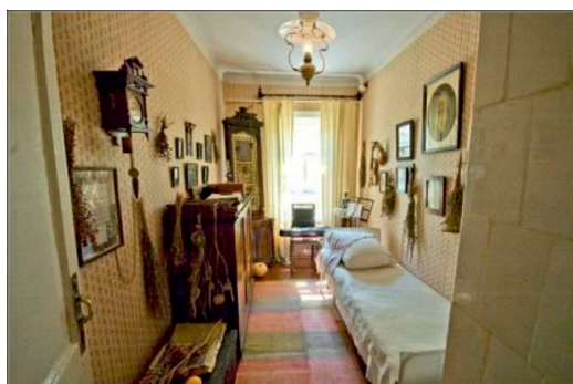
Рис. 9. Комната П.Е. Чехова