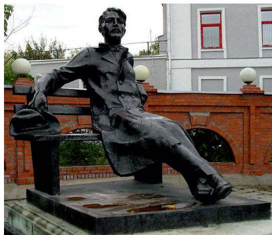
Рис. 17. Памятник А.П. Чехову в Серпухове (2009 г.)

Слайд 19. В истории мировой культуры Антон Павлович Чехов остался как мастер короткого рассказа и нового типа пьесы – трагикомедии. Его умение найти точную художественную деталь, на первый взгляд малозначащую, талант отражения тончайших душевных переживаний героев снискали ему известность во многих странах мира. Мягкий юмор, едкая сатира, грустные и печальные мотивы чеховского творчества оказали огромное влияние на развитие не только отечественной, но и всей мировой литературы. Ему поставлены памятники (рис. 17).