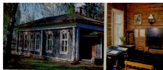
Рис. 11. Мелиховская школа

Слайд 13. Здесь вы видите мелиховскую школу (рис. 11).