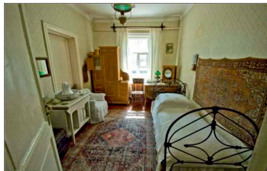
Рис. 8. Комната А.П. Чехова