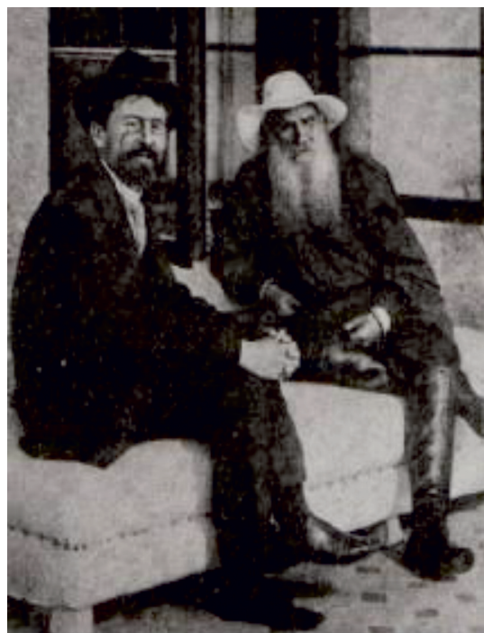
Рис. 14. А.П. Чехов и Л.Н. Толстой

Слайд 17. Здесь у него бывали Шаяпин, Куприн, Бунин, Горький, Короленко, Станиславский, Левитан, Мамин-Сибиряк, Леонид Андреев, Немирович-Данченко и другие (рис. 14-15).