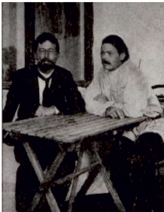
Рис. 15. А.П. Чехов и А.М. Пешков (Горький)

Слайд 18. Антон Павлович любил, чтобы в жизни и в литературном творчестве всё было просто и понятно. Спокойной и простой была его смерть. Умер Чехов в курортном городке Баденвейлере, в Германии. По свидетельству его врача, он сказал ему спокойно: «Скоро, доктор, умру». Он выпил предложенного ему врачом шампанского, тихо лёг на левый бок и вскоре умолкнул навсегда. Тело Чехова было перевезено в Москву, похоронен он на Новодевичьем кладбище (рис. 16).