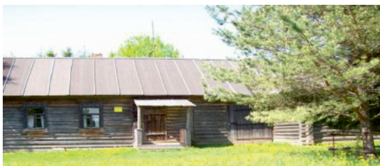
В. Хутор Загорье на Смоленщине

(по 0,5 балла за каждый правильный ответ, макс. – 1,5 балла)